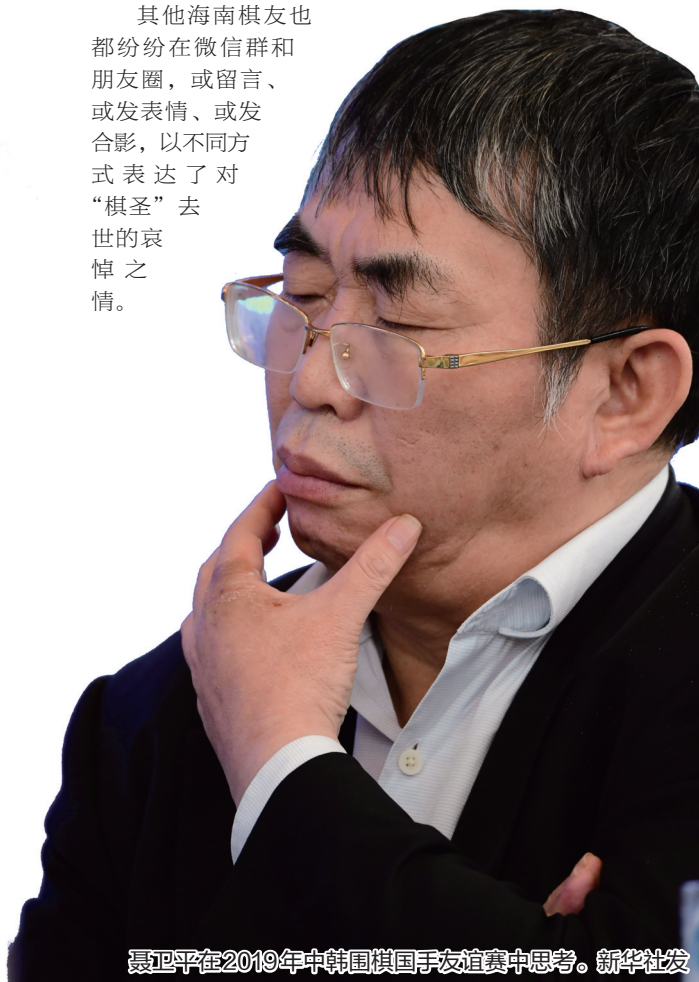
聂卫平在2019年中韩围棋国手友谊赛中思考。