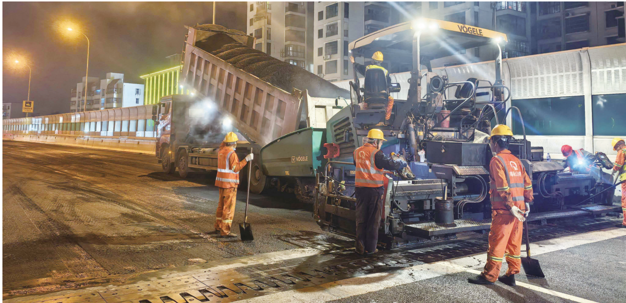
海秀快速路沥青翻新施工现场

南国都市报1月30日讯(记者 李文韬 文/图)1月30日凌晨,在海秀快速路长滨路匝道至丘海大道下匝道段,几台工程车正在作业,这是海口市建工城市运营管理有限公司正在开展海秀快速路的沥青修复工程,预计2月1日完工。