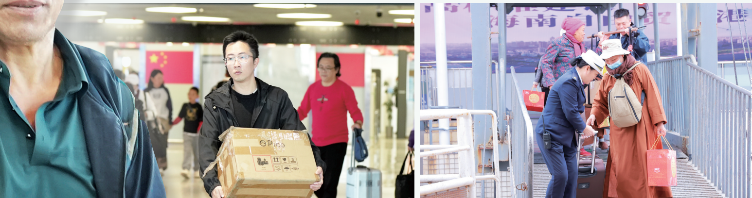
2月2日春运首日琼州海峡迎来客流高峰。