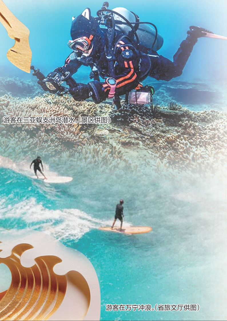
游客在三亚蜈支洲岛潜水。