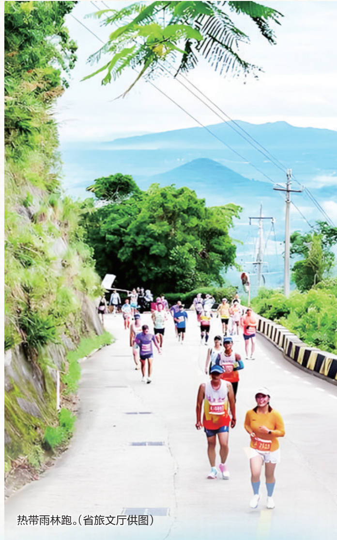
热带雨林跑。

万宁日月湾音乐嘉年华于2月20日至22日(大年初四、初五、初六),连续3天在日月湾热力全开,27组音乐人轮番登台,给市民游客带来一场视听盛宴。2026年全国冲浪冠军赛将于2月26日-3月6日在万宁日月湾举行,公开组、U18、U16组的男女运动员将展开精彩角逐。此外,日月湾一条街的滨海餐吧将推出形式多样的派对,在这里可以品尝美食、享受热闹氛围,结交来自五湖四海的朋友。