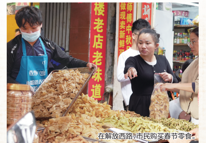
在解放西路,市民购买春节零食。