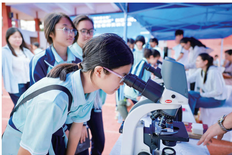
临高县博文学校的学生参观标本以及体验使用显微镜。

答案是肯定的。有了这个想法后,海南大学实验室与设备管理处便启动了“教学设备再生计划”,把这些本该报废的显微镜翻出来,一台一台检