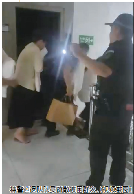
特警巡逻队队员疏散被困群众。(现场截图)