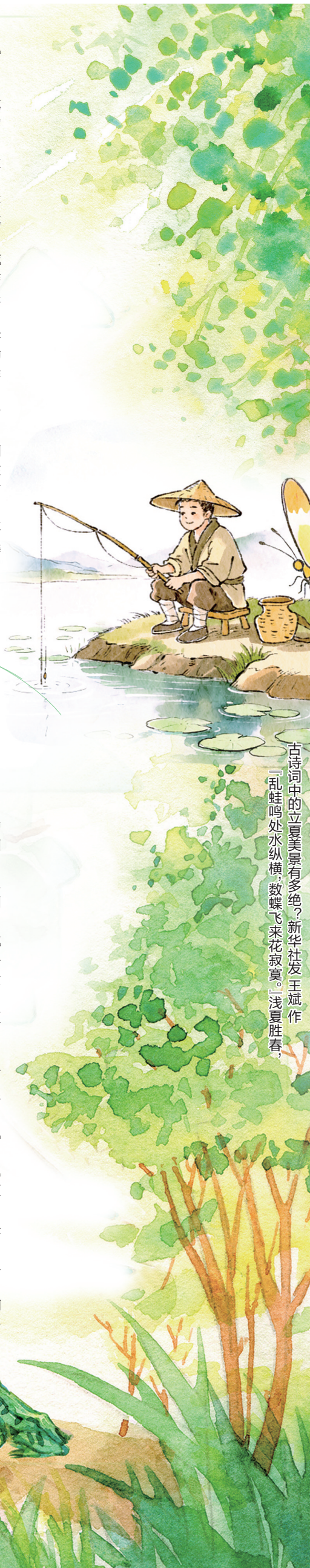
古诗词中的立夏美景有多绝？王斌作 「乱蛙鸣处水纵横，数蝶飞来花寂寥。」浅夏胜春